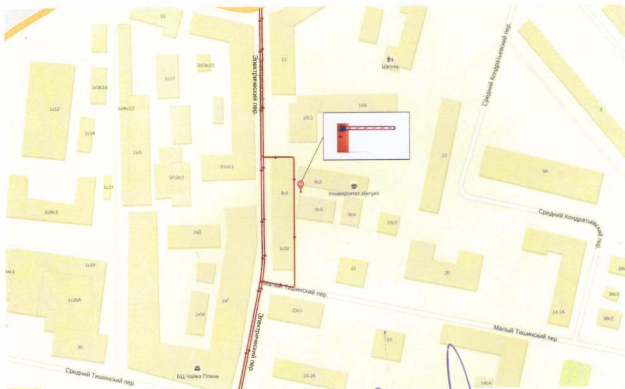
СХЕМА установки ограждающего устройства (АВТОМАТИЧЕСКИЙ ДОРОЖНЫЙ ШЛАГБАУМ G3750)

общего собрания собственников помещений в многоквартирном доме в форме очного голосования расположенного по адресу: Электрический пер, дом 8 строение 4