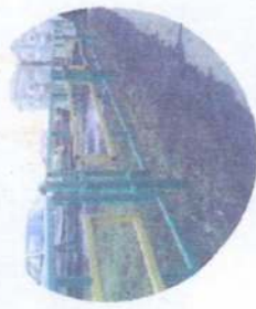
Установка декоративных заборов

Рекомендуемое расширение проезжей части с установкой устройств для предотвращения сползания грунта.