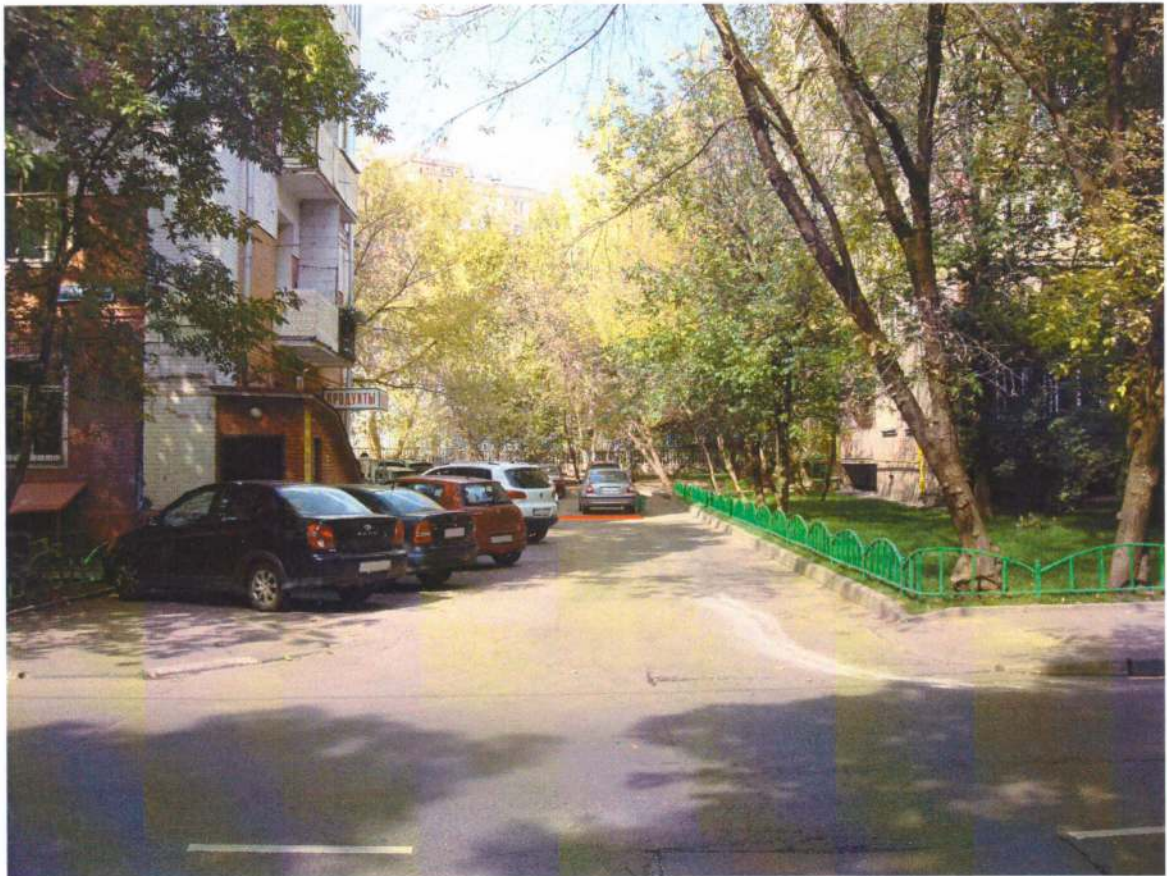
Рис.2 Вид со стороны Б. Тишинского пер. на въезд во внутренний двор д.40 стр. 1 и д.40 стр.2