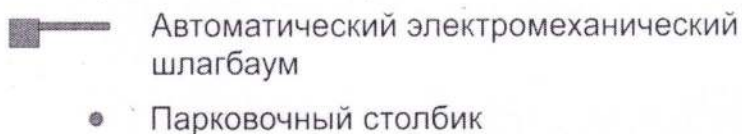
Рис. 1 Схема размещения ограждающих конструкций

1.2. Тип шлагбаума: Шлагбаум автоматический с электромеханическим приводом поднятия и опускания стрелы.